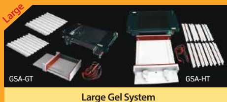
Large Gel System