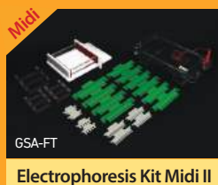
Electrophoresis Kit Midi II