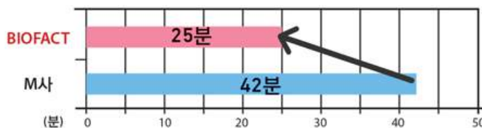
추출 시간 타사 비교